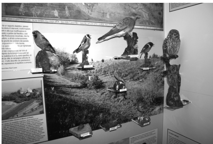
In alto: particolare del diorama del faggeto nella valle del torrente Ospitale; sotto: il box dedicato ai coltivi nella vetrina degli ambienti agrari e delle siepi.